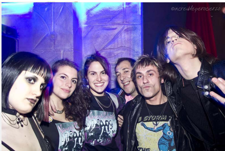
Fans de las Nancys Rubias en la Sala López (Zaragoza)