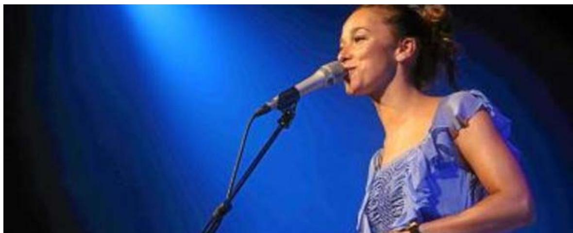
La cantante Beth, en una actuación reciente.

Se hizo popular en 2003 con su paso en 'Operación Triunfo'. Hoy, a las 21.30, da un concierto acústico en la Sala López y presenta su tercer disco, 'Segueix-me el fil', grabado en catalán.